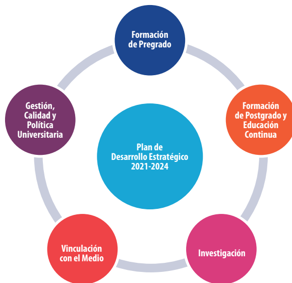
Ejes del Plan de Desarrollo Estratégico 2021-2024