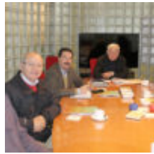
Jurado Concurso Juan Bosch

Para el 31 de agosto del año en curso, a las 16:00 hrs., en dependencias del Cine Club localizado en el Campus Isla Teja de la UACH, está prevista la Ceremonia de Premiación y Reconocimiento a los escritores ganadores del concurso.